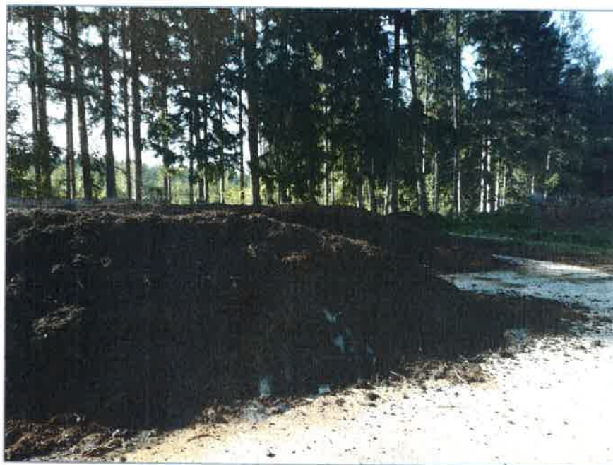
Zakládky kompostu na komunitní kompostárně v Jilemnici