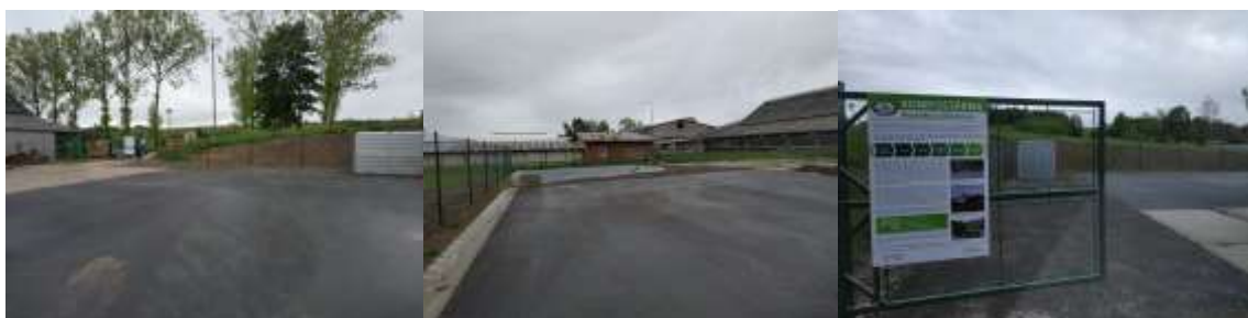
Nově rozšířená plocha kompostárny v Roztokách u Jilemnice